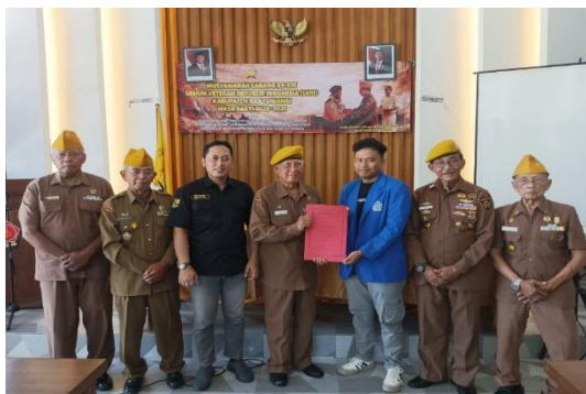
Gambar 5. Mahasiswa mendapatkan penghargaan dari DPD LVRI Jatim di damping DPC LVRI Banyuwangi dan Perwakilan UNIBA