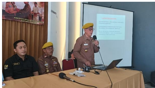
Gambar 3. Veteran sebagai pelaku Sejarah dalam penyampaian Materi JSN 45

sejarah. Hal ini terlihat dari keterlibatan aktif peserta selama kegiatan berlangsung, baik dalam sesi diskusi maupun refleksi. Mahasiswa menunjukkan pemahaman yang lebih baik mengenai makna perjuangan bangsa dan pentingnya menjaga identitas nasional di tengah pengaruh globalisasi.