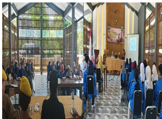
Gambar 4. Mahasiswa Mengikuti JSN 45 dengan baik

Melalui kegiatan pendampingan, mahasiswa mulai menyadari bahwa nilai-nilai JSN 45 tidak hanya relevan dalam konteks sejarah perjuangan kemerdekaan, tetapi juga dapat diimplementasikan dalam kehidupan sehari-hari. Nilai-nilai seperti disiplin, tanggung jawab, kerja sama, toleransi, dan kepedulian sosial dipandang sebagai bagian penting dalam membangun karakter generasi muda yang berkualitas. Kesadaran tersebut menjadi indikator bahwa proses internalisasi nilai kebangsaan yang dilakukan telah berjalan dengan baik.