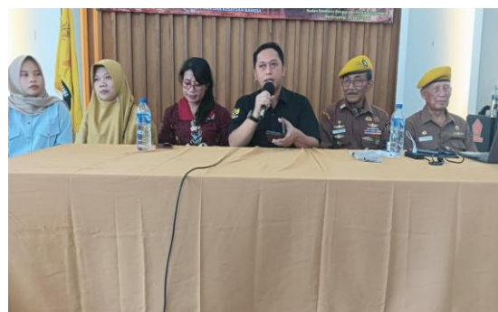
Gambar 2. Pengarahan dan sekaligus koordinasi dari Dekan FKIP

Kegiatan pengabdian kepada masyarakat berupa pendampingan penguatan Jiwa, Semangat, dan Nilai Juang 45 (JSN 45) dilaksanakan melalui kerja sama antara FKIP Universitas PGRI Banyuwangi dengan Legiun Veteran Republik Indonesia (LVRI) Kabupaten Banyuwangi, Provinsi Jawa Timur, dilaksanakan pada Senin, 20 April 2026 (Gambar 2). Kegiatan ini diikuti oleh mahasiswa prodi Pendidikan Sejarah, Pendidikan Pancasila dan Kewarganegaraan (PPKN) dan Bimbingan Konseling (BK) sebagai sasaran utama program dalam rangka memperkuat nasionalisme dan kesadaran sejarah generasi muda. Kegiatan dilaksanakan di kantor Badan Kesatuan Bangsa dan Politik (Bakesbangpol) Kabupaten Banyuwangi. Kegiatan diawali dengan penyampaian materi mengenai pentingnya nasionalisme, tantangan kebangsaan di era digital, serta peran generasi muda dalam menjaga persatuan dan keutuhan bangsa.