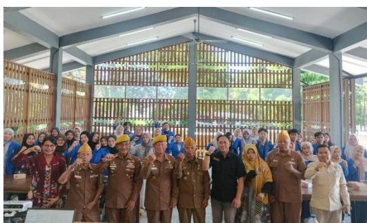
Gambar 6. Kegiatan ditutup dengan foto bersama